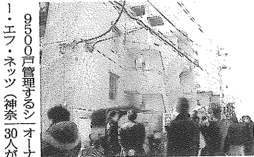
9500戸管理するシ・エフ・ネッツ(神奈)オーナーや投資家など約30人が参加した。同イベント